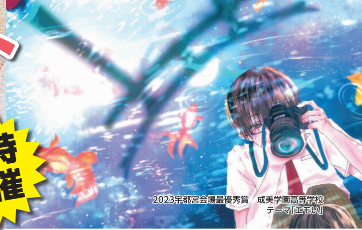
2023宇都宮会場最優秀賞 成美学園高等学校 テーマ「エモい」