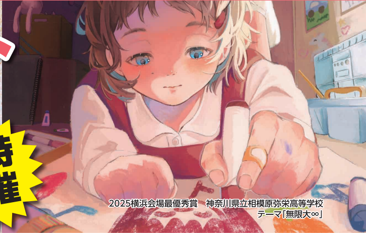
2025横浜会場最優秀賞 神奈川県立相模原弥栄高等学校 テーマ「無限大∞」