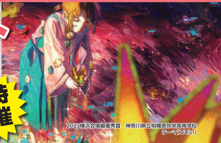
2023横浜会場最優秀賞 神奈川県立相模原弥栄高等学校 テーマ「エモい」