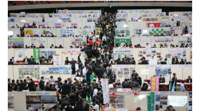
▼就職フェアの様子

■対象 大阪医療福祉専門学校(主幹校) 大阪医療看護専門学校 大阪医療技術学園専門学校 美作市スポーツ医療看護専門学校 大阪ハイテクノロジー専門学校 滋慶医療科学大学 大阪保健福祉専門学校