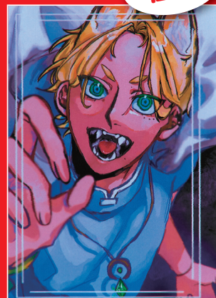
「真夏のオリオン」 県立松山南高等学校 砥部分校