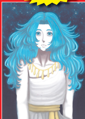
「闇夜の一歩星」 屋久島おおぞら高等学校