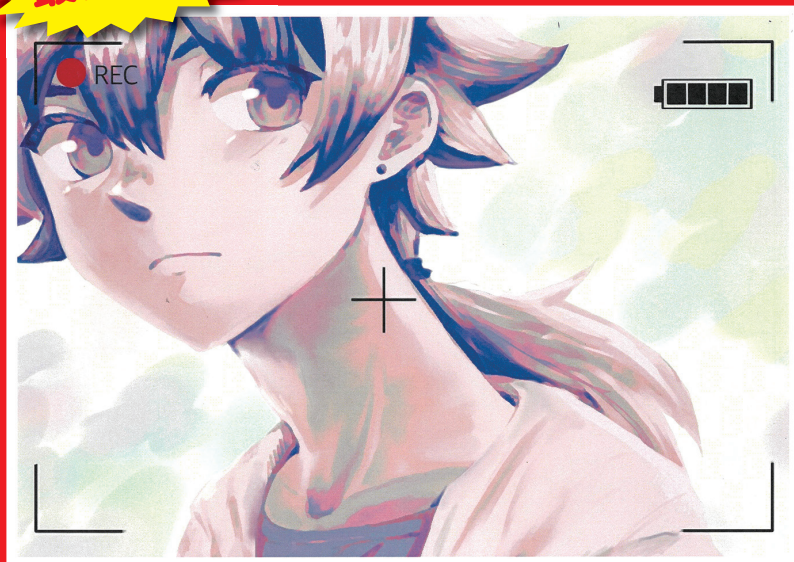
「おでかけの記録」 県立松山南高等学校 砥部分校