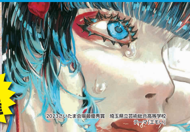
2023さいたま会場最優秀賞 埼玉県立芸術総合高等学校 テーマ「エモい」